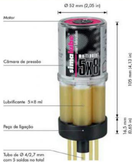
simalube multipoint - O lubrificador multiponto automático

Quando há pouco espaço disponível o simalube de 15 ml oferece a solução perfeita. O seu tamanho compacto torna-o no lubrificador mais pequeno do mercado mundial. No funcionamento não se distingue dos lubrificadores simalube maiores e proporciona vantagens iguais.