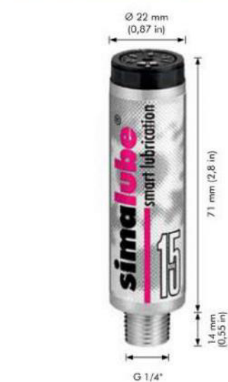
simalube 15 ml - O lubrificador automático mais pequeno

Quando há pouco espaço disponível o simalube de 15 ml oferece a solução perfeita. O seu tamanho compacto torna-o no lubrificador mais pequeno do mercado mundial. No funcionamento não se distingue dos lubrificadores simalube maiores e proporciona vantagens iguais.