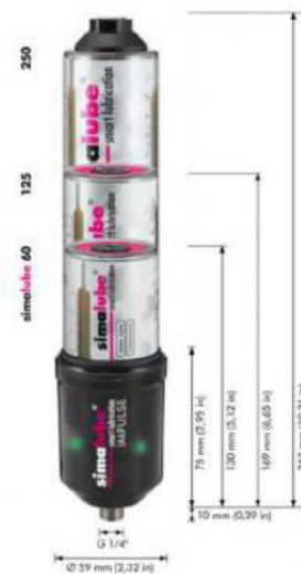
simalube IMPULSE - Amplificador de pressão até 10 bar

O simalube multiponto abastece 5 pontos de lubrificação em simultâneo até um ano, tal como comprovadamente sucede com os outros lubrificadores simalube. Este lubrificador pode ser ligado a uma peça recetora o que permite a sua substituição fácil e rápida quando fica vazio.