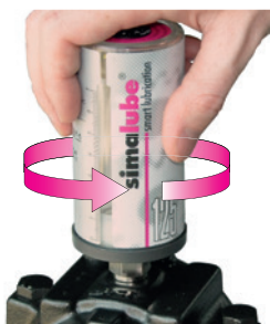
Recarregue ou elimine os lubrificadores vazios