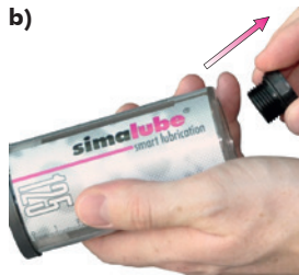
b) Remova o gerador de gás com uma chave de porcas (SW21mm)