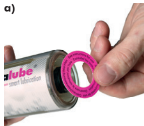
a) Remova o disco da tampa