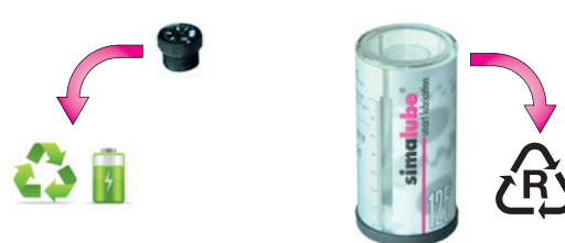
Coloque o gerador de gás intacto na reciclagem de baterias e o copo vazio na reciclagem de plástico. (Aviso: elimine a massa remanescente separadamente)