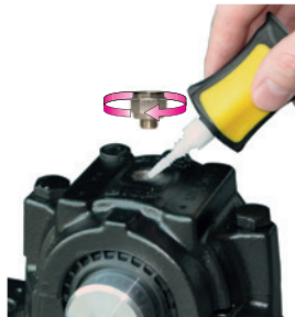
Enroscar o bico de redução (se necessário, selar o ponto de lubrificação)