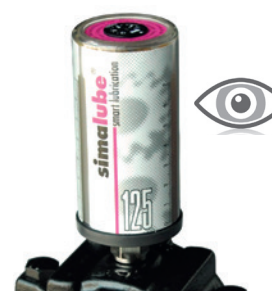
Verificar regularmente o simalube