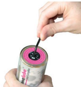
Activar o tempo de fornecimento com a chave Allen de 3 mm