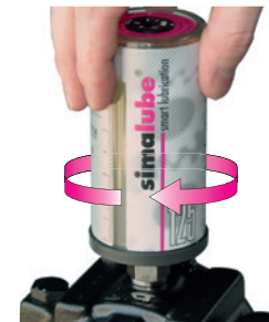
Enroscar o lubrificador