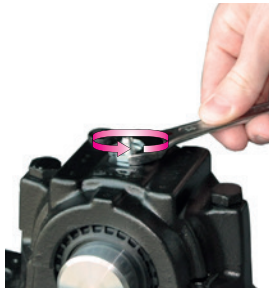
Remova o bico conector