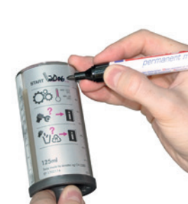
Escrever a data de activação