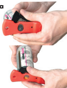
Retirar o encaixe