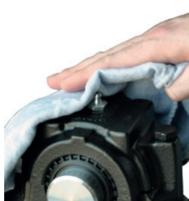
Limpe o ponto de lubrificação